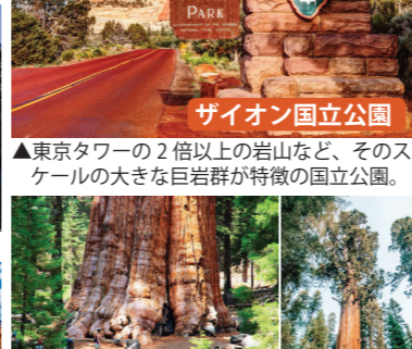
サイオン国立公園