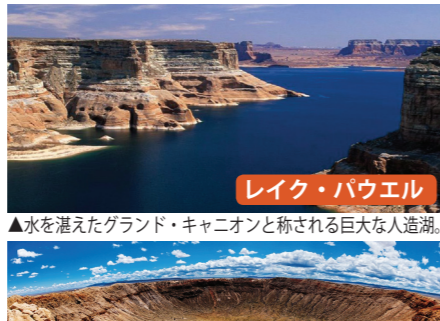
レイク・パウエル