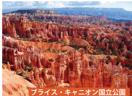
ブライス・キャニオン国立公園

▲東西446kmにわたって延びる長大な大峡谷。コロラド川の浸食によって作り出された大地の作品。朝夕の感動の光景にもご案内します。(写真はデザートビュー・ポイントからの眺望)