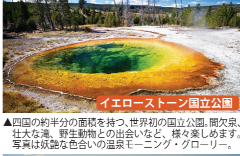
イエローストーン国立公園

▲茶褐色の岩肌と緑の草木の茂るコントラストが美しく、アメリカの先住民の聖地だったセドナは大地のエネルギーを感じられる「パワースポット」として有名。