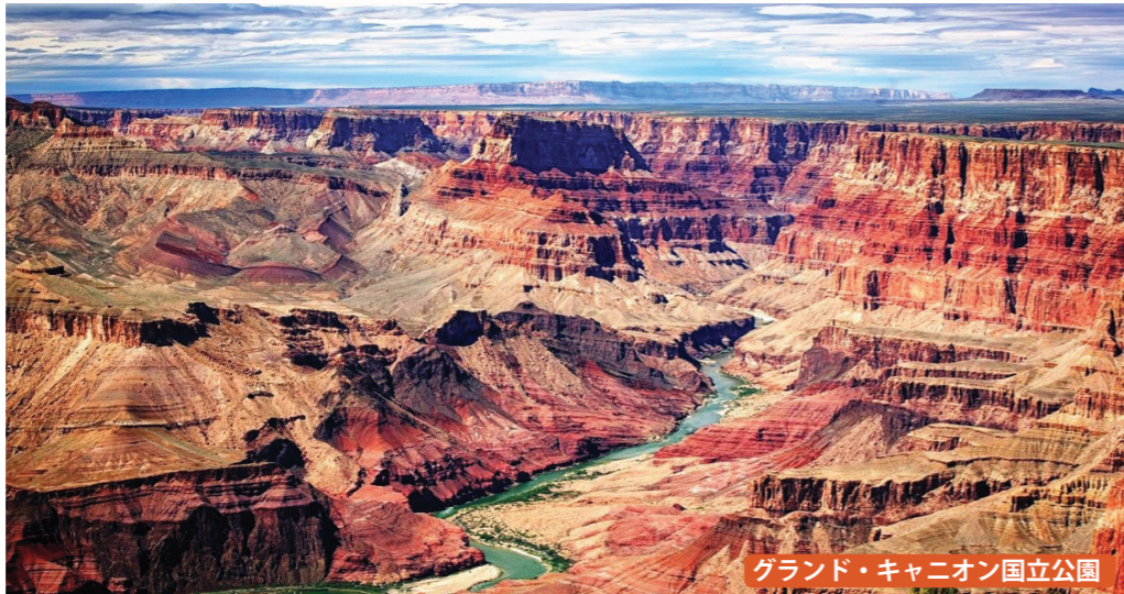
グランド・キャニオン国立公園