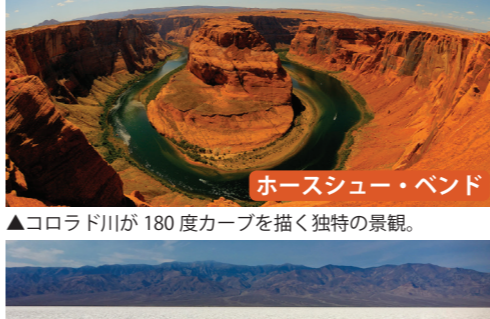
ホースシュー・ベンド

▲四国の約半分の面積を持つ、世界初の国立公園。間欠泉、壮大な滝、野生動物との出会いなど、様々楽しめます。写真は妖艶な色合いの温泉モーニング・グローリー。