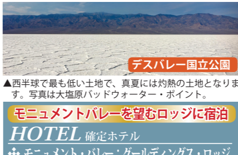
デスバレー国立公園

▲西半球で最も低い土地で、真夏には灼熱の土地となります。写真は大塩原パッドウォーター・ポイント。