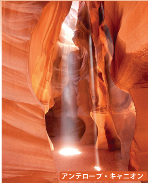
アンテロープ・キャニオン

▲淡い赤褐色の岩肌が幻想的に美しい、洞窟のように細長い渓谷。鉄砲水の浸食によって創り出されたその岩肌は、水の流れがそのまま焼きついたかのような模様を成しています。まさに大地の芸術。