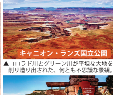
キャニオン・ランズ国立公園