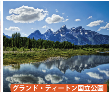
グランド・ティートン国立公園

▲突起物のような奇岩がびっしりと並ぶ。大地が剣山になってしまったかのような不思議な空間。