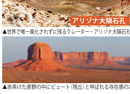
モニュメント・バレー

▲赤茶けた原野の中にビュート(残丘)と呼ばれる存在感のある岩山が林立。アメリカ西部を代表する光景です。