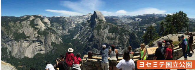
ヨセミテ国立公園