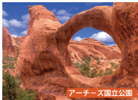
アーチズ国立公園