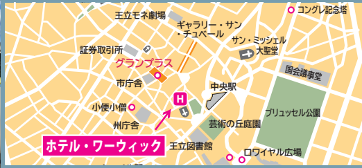
ホテル・ワーウィック