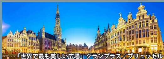
「世界で最も美しい広場」グランプラス/ブリュッセル