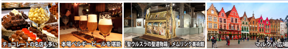
チョコレートの名店も多い