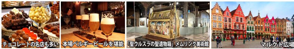
チョコレートの名店も多い