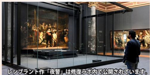
レンブラント作「夜警」は修復ラボ内で公開されています。

開館から130年以上の歴史をもつオランダ最大の美術館。レンブラントやフェルメールなど、オランダ黄金時代の巨匠たちの名画を中心に展示しています。