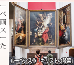
ルーベンス作「キリストの降架」

アントワープにあるベルギー最大のゴシック教会。ルーベンスの最高傑作である祭壇画「キリストの降架」、「キリストの昇架」など「フランダースの犬」のネロ少年が憧れた絵画がご覧いただけます。