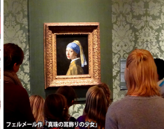
フェルメール作「真珠の耳飾りの少女」