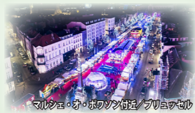
マルクト・オ・ボワツ附近/ブリュッセル

ブルージュ「屋根のない博物館」と讃えられる美しい歴史地区がより一層輝く季節です。