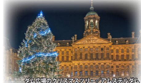
ダム広場のクリスマスツリー/アムステルダム

洞窟内クリスマス・マーケット オランダ南部のファルケンブルクでは、かつて石灰岩などの採掘で掘られた洞窟の中でマーケットが開かれます。地下の洞窟で過ごす幻想的なクリスマスは貴重な体験です。