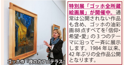
ゴッホ作「夜のカフェテラス」

オランダ中部、デ・ホーヘ・フェルウェ国立公園内の森の中に佇む美術館。世界でも屈指のゴッホ・コレクションの他、ピカソ、ミレーなどの作品を所蔵。