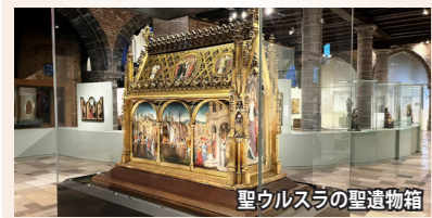
聖ウルスラの聖遺物箱

ブルージュにある12世紀の病院の一部を改装した美術館。ベルギー7大秘宝のひとつ「聖ウルスラの聖遺物箱」は必見。