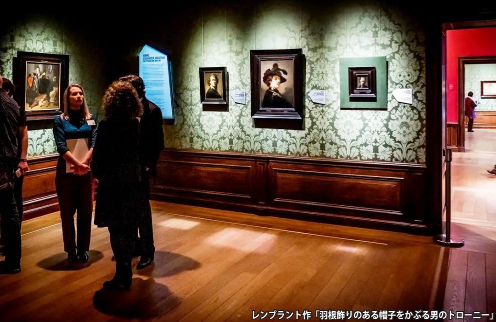
レンブラント作「羽根飾りのある帽子をかぶる男のトロニー」