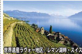
世界遺産ラヴォー地区/レマン湖畔/スイス