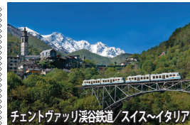
チェントヴァッリ渓谷鉄道/スイス～イタリア