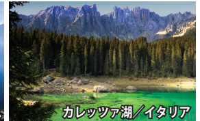
カレツェッタ湖/イタリア