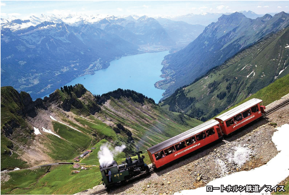
ロートホルン鉄道/スイス