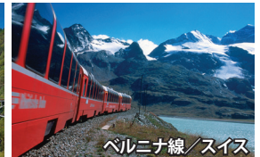
ベルニナ線/スイス