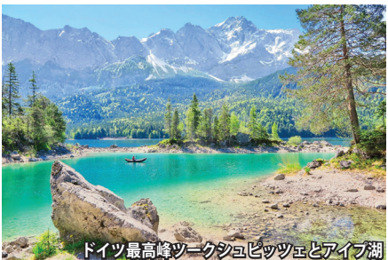
ドイツ最高峰ツークシュピッツェとアイブ湖