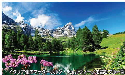
イタリア側のマッターホルン・チェルヴィーンを望むブルー湖