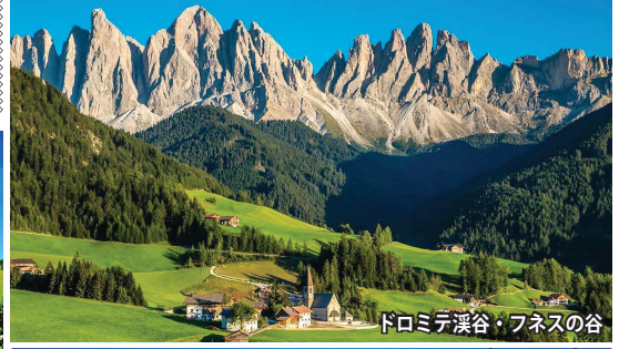
ドロミテ渓谷・フネスの谷