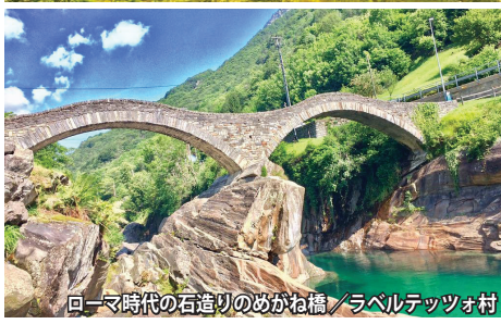
ローマ時代の石造りのめがね橋/ラベルテツォ村