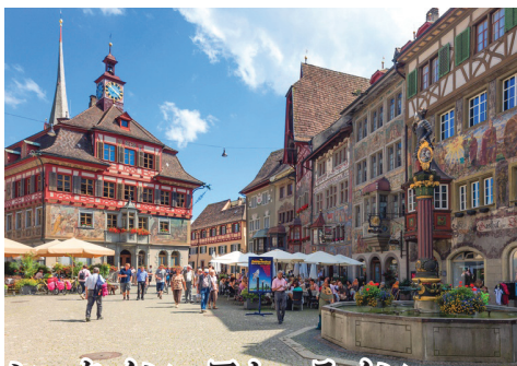
シュタイン・アム・ライン ライン河のほとりに佇む小さな街で、「ラインの石（宝石）」という名前のように、美しい壁画が描かれた家々が特徴的な美しい街。