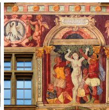
騎士の家（シャッフハウゼン）