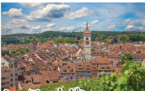
シャッフハウゼン ライン川沿いの水運交易で栄えた古都。旧市街には美しい壁画が描かれた騎士の家など中世の建物が並ぶ。