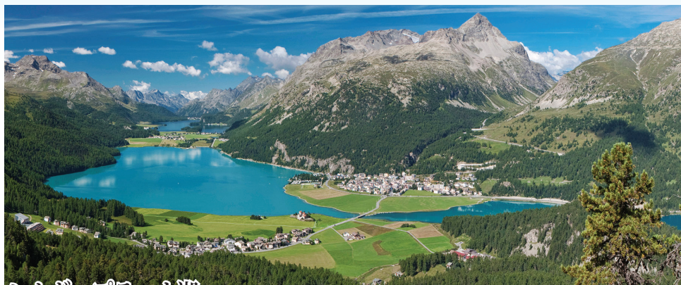
シルヴァプラナ湖 コルヴァッチ展望台行きのロープウェイから青く輝く姿が眺められます。