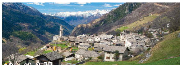
ソーリオ村 オーバーエンガディン最奥の村。石造りの家々が並ぶ中世の村は、かつてセガンティーニやヘルマン・ヘッセも度々訪れました。