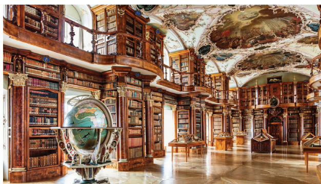
修道院図書館（世界遺産）

シュタム・アム・ライン、ザンクトガレン、アッペンツェルなど、中世の雰囲気が残り、壁画と出窓が美しい小さな町々を訪ねます。また、小国リヒテンシュタインも訪問。