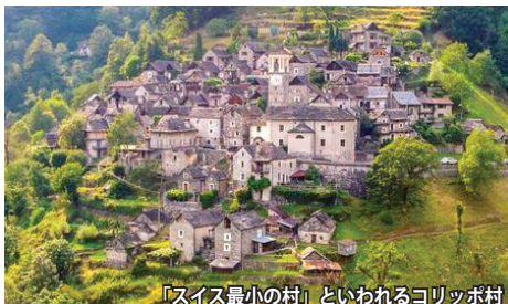
「スイス最小の村」といわれるコリッポ村

イタリアに近い南部ティチーノ州、青緑色の透明度の高いベルザスカ川の渓谷沿いに、時が止まったかのような中世の石造りの小村が点在します。