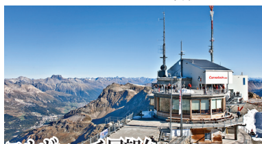
コルヴァッチ展望台 エンガディン地方での最高地点。ベルニナ・アルプス最高峰ピッツ・ベルニナを間近に望む。