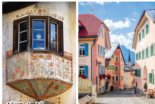
ガアルダ ウンターエンガディン地方のガアルダは、この地方伝統のスグラフィット紋様といわれる伝統的装飾画が描かれた建物が多く残ります。「スイスの美しい村」に指定され、町全体が野外博物館のような素敵な家並みが続きます

スイス東南部、グラウビュンデン州の山岳地帯に源に北東へと流れるイン川。このイン川が流れる谷が「エンガディン」。山々に囲まれた谷間で、ロマンシュ語圏の独特の文化が育まれたため、他のスイスの町や村とは異なる雰囲気があります。