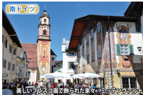
美しいフレスコ画で飾られた家々/ミッテンヴァルト

北イタリア・ドロミテ山塊とオーストリア・チロル地方の奥深くまで訪れる旅。毎日が絶景の連続です。 ◇北ドロミテ・フネスの谷へ。最奥の村サンタ・マッダレーナ村を訪れ、小さな教会とドロミテ山塊のまるで絵葉書のような絶景を堪能。 ◇ドロミテでは、アルペ・ディ・シウジも訪問。丘陵台地の周囲にドロミテの岩峰が連なり、まさに「ドロミテの展望台」。放牧地でもあり、のどかで雄大な光景が広がります。 ◇南ドイツではカラフルなフレスコ画が描かれた美しい家々が並ぶミッテンヴァルトとドイツ最高峰ツークシュピッツェ山頂へ。 ◇ドイツ最高峰ツークシュピッツェの絶景が楽しめるのどかな村レルモースも訪れます。