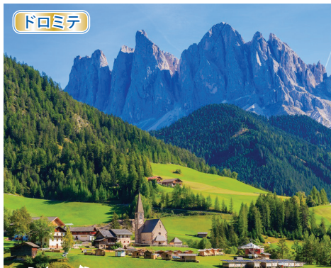
フネスの谷 ドロミテ最奥・フネスの谷ではサンタ・マッダレーナ村を訪れ、小さな教会とドロミテ山塊のまるで絵葉書のような絶景を堪能下さい。

※悪天候によりロープウェイが運休となり展望台に向かえない場合やハイキングが出来ない場合もございます。