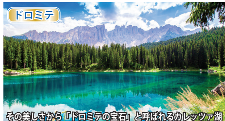
その美しさから「ドロミテの宝石」と呼ばれるカレツァ湖