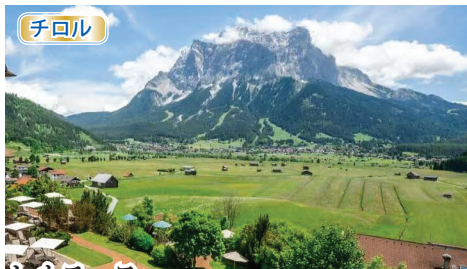
レルモース ドイツ最高峰ツークシュピッツェ山(2,962m)の全体像が見渡せるオーストリア側の村。