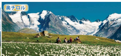
オーバーグルグル チロル地方エッツの谷の最奥の町。壁絵や花々が家屋を飾る美しい村です。リフトを乗り継ぎ、二つの雄大な氷河の絶景を楽しめるホーエ・ムート展望台にもご案内します。