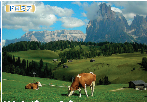
アルペ・ディ・シウジ 丘陵台地の周囲にドロミテの岩峰が連なり、まさに「ドロミテの展望台」。放牧地でもあり、のどかで雄大な光景が広がります。