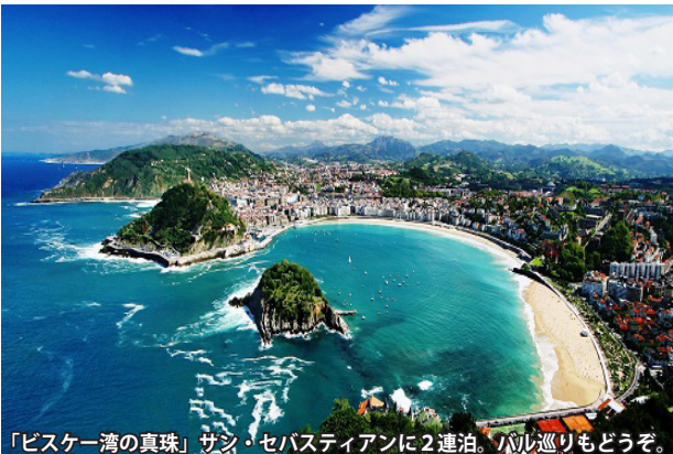
「ビスケー湾の真珠」サン・セバスティアンに2連泊。バル巡りもどうぞ。