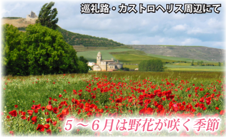
巡礼路・カストロヘリス周辺まで

●利用予定航空会社：カタール航空、エミレーツ航空、LOTポーランド航空など裏面リスト内航空会社。 ●添乗員：成田または羽田空港より全行程同行。 ●食事：朝食10回・昼食8回・夕食8回(機内食除く) ●ホテル：スタンダード～ファーストクラスの厳選ホテル。詳しくはお問い合わせ下さい。 ●最少催行人員：10名(最大20名) ●海外空港諸税：旅行代金に含まれます。 ●旅券の残存有効期間：帰国時3カ月以上 ◆旅行代金以外に下記費用を別途申し受けます◆ ●成田空港使用料・保安サービス料：3,160円 ●国際観光旅客税：1,000円 ●燃油サーチャージ：込み