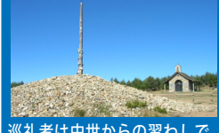
巡礼者は中世からの習わしで、 イラゴ峠に立つ鉄の十字架に祈りを込めて石を積み。