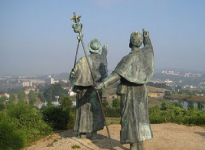
大聖堂まであと4.4km ゴソの丘（歓喜の丘）