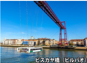
ビスカヤ橋（ビルバオ）

フレンチ・ピレネーにも足を伸ばし、ガヴァルニー大圏谷も訪問。氷河の侵食によって形成されたU字谷で、谷底からの壁の高さは約1,500mに達します。ヨーロッパ最大のガヴァルニー滝(落差422m)を見ながらのハイキングをお楽しみ下さい。その美しさは、ヴィクトル・ユーゴーが「天然の大劇場」と称えたほど。