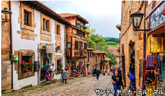
サンティヤーナ・デル・マル

ビルバオ名物・世界遺産の運搬橋「ビスカヤ橋」。橋桁からワイヤーで吊り下げられたゴンドラが、人や車を載せて移動するユニークな仕組みです。乗車体験をどうぞ。