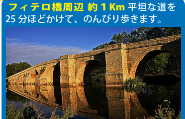
フィテロ橋周辺 約1Km 平坦な道を25分ほどかけて、のんびり歩きます。