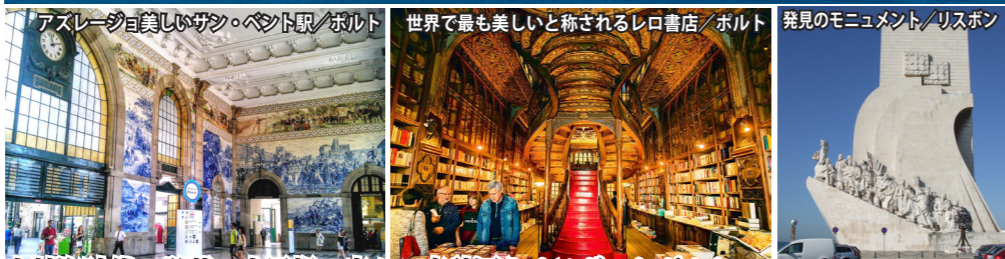
アズレージョ美しいサン・ベント駅/ポルト