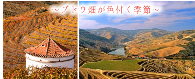
～ブドウ畑が色付く季節～

世界遺産ドウロ渓谷 ドウロ川の上流、山の斜面に広がるブドウ畑と蛇行するドウロ川が独特の景観を生み出します。10月末～11月上旬は、ブドウ畑が黄金色に色付く黄葉の時期です。