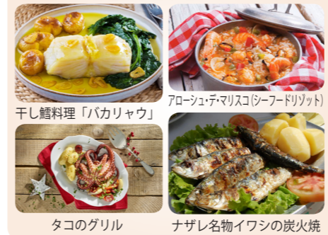
干し鰯料理「バカリヤウ」