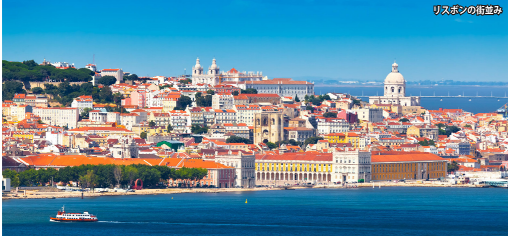
リスボンの街並み