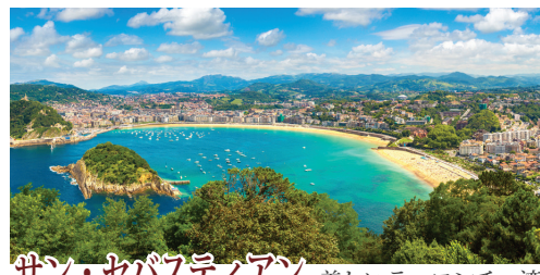
サン・セバスティアン 美しいラ・コンチャ湾を望むサン・セバスティアンは「ビスケー湾の真珠」と呼ばれ、スペイン王家の保養地として発展しました。山海の幸に恵まれた美食の町で、旧市街には星付きレストランやバルが集まります。