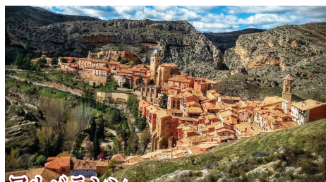
アルバラシン まるで中世で時を止めたかのような街並みが残る「美しい村」。

通常のスペイン周遊ツアーでは訪れる機会が少ない、スペイン北東部のアラゴン州、リオハ州、ナバーラ州を巡った後、異郷の地で美食でも知られるバスク地方を訪れます。ムデハル様式の美しい町々に加え、日本では殆ど知られていないスペインの準砂漠地帯バルデナス・レアレスなど、知られざる大自然の景勝地も堪能します。その他、リオハ・ワインのワイナリーを訪れたり、フレンチ・バスクのバイヨンヌにも足を伸ばすなど、バラエティに富んだ観光内容となっております。