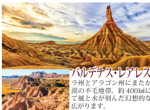
バルデナス・レアレス ナバーラ州とアラゴン州にまたがる準砂漠の不毛地帯。約400kmにわたって風と水が刻んだ幻想的な地形が広がります。