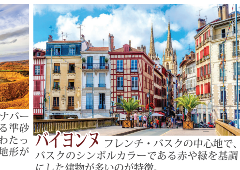
バイヨンヌ フレンチ・バスクの中心地で、バスクのシンボルカラーである赤や緑を基調にした建物が多いのが特徴。

イヤホンガイド・サービスを使用します。 昼食時、夕食時にドリンク・ウォーターをサービスします。