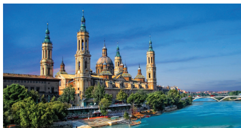
アラゴン王国の古都サラゴサ スペイン第5の都市サラゴサ。世界で初めて聖母マリアに捧げられた教会である聖母ピラール教会、11世紀にイスラム王朝によって建造された繊細な装飾が美しいムデハル様式のアルハフェリア宮殿など歴史的見所が点在しています。

※教会、修道院などは、ミサや巡礼の時期、その他の理由で入場出来ない場合もございます。その場合、代替観光にご案内します。