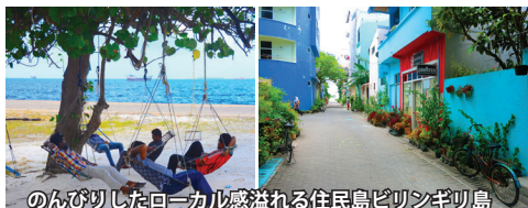
のんびりとしたローカル感溢れる住民島ビリンギリ島

イヤホンガイド・サービスを使用します。 昼食時、夕食時にドリンク・ウォーターをサービスします。