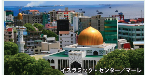
イスラミック・センター/マーレ

★様々な角度からモルディブ共和国にアプローチ★ 首都マーレは東西約2.5km、南北約1.5kmの小さな島で、モルディブ全人口の約四分の一にあたる10万人もの人々が居住し、世界一の人口密度といわれています。ビルが密集し、金色のモスクや古い墓跡、活気あふれるフィッシュマーケットなどリゾート地ではない、アジアの一国としてのモルディブが垣間見えるのです。また、白砂の砂州・サンドバンクを訪れ、ビーチ・リゾート体験をしたり、住民島ビリンギリ島を訪れ、ローカル感溢れるのんびりとした風情に触れたり、モルディブを様々な角度からご覧いただけます。