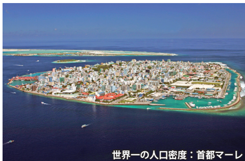
世界一の人口密度：首都マーレ