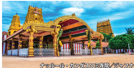
ナッフルール・カンダスワミ寺院/ジャフナ

スリランカの人口のうち約7割がシンハラ人、2割弱をタミル人であり、タミル人は主に島の北部を中心に居住します。両者は古代より混住してきましたが、イギリス植民地時代にタミル人を重用する分割統治政策がとられた事、及び独立後にシンハラ人優遇政策がとられた事により、民族間の対立が高まり、1983年より2009年に至るまで内戦状態が続きました。その内戦も終結、ホテルや道路など観光インフラ整備も進み、多くの観光客が訪れるようになりました。北部地域の中心ジャフナには、タミル人が信仰するヒンドゥーの神々を祀る神殿など歴史的に重要な見所が点在します。南部の仏教世界とは全く違った様相です。また、内戦中は立ち入り禁止となっていたウィルパトゥ国立公園は、スリランカ最大規模。アジア象、ナマケグマ、スリランカ・ヒョウなど多くの哺乳類が生息しています。訪れる観光客はまだ多くないため、ゆったりとサファリを楽しむことが出来ます。