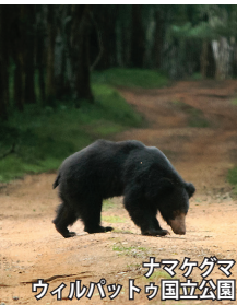
ナマケグマ ウィルパトゥ国立公園