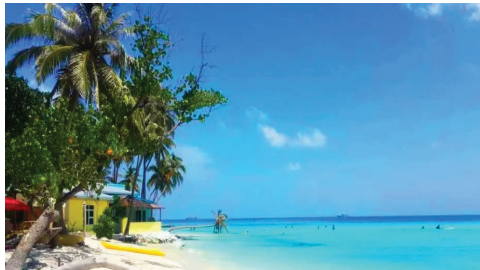
北または南マーレ環礁のリゾート。アイランドにも訪れます。訪問リゾートの一例：アダーラツ・プレステージ・ヴァドゥ