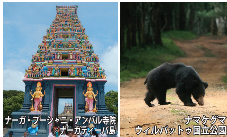
ナーガ・ブーシャニ・アンバル寺院 ナーガディーバ島