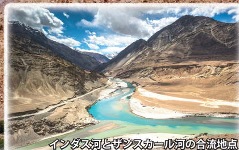
インダス河とザシスカール河の合流地点

ラダックは、インド最北部に位置する平均標高 3,500 m を超える山岳地帯。かつてはラダック王国という独立した仏教王国でしたが、19 世紀に滅亡し、後にインド領となりました。周囲をヒマラヤ山脈やカラコルム山脈に囲まれ、盆地の谷間にインダス河が流れます。森林限界を超えた標高のため高木は育たず、年間降水量も僅か 80 ミリ程度のため、生きるものの影すら見えない乾ききった岩山が果てなく続きます。その圧倒的自然景観はまさに「月面世界」。1974 年まで外国人の入国が許されてなかったため、中国領のチベットよりもチベットらしい風習が残っているといわれ、また、寺院や僧院に残る仏教芸術のレベルはチベット文化圏全体でも一、二を争うほどと評価されているのです。