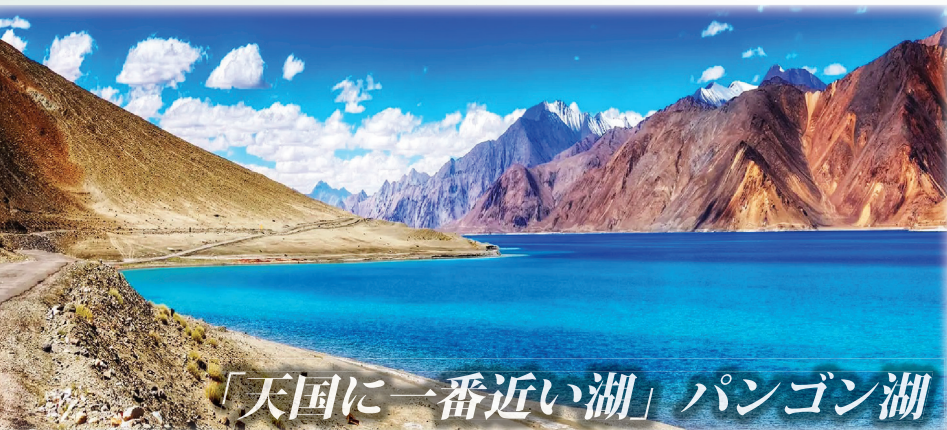
「天国に一番近い湖」パンゴン湖

出発日：7月26日、8月20日 旅行代金：339,000円～349,000円 現地手配会社協力の謝恩価格