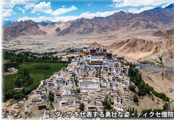
ラダックを代表する勇壮な姿・ティクセ僧院