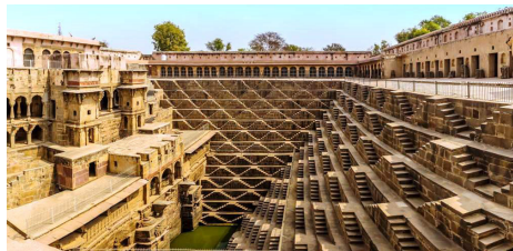
チャンド・パオリの階段井戸 9世紀建造の深さ20メートル、約3,500段の階段が幾何学模様を描くインド最大級の階段井戸。