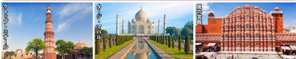
デリー ムガル帝国の栄華を伝えるインドの首都。壮麗なイスラム建築と近代都市が共存する歴史と文化の中心地。