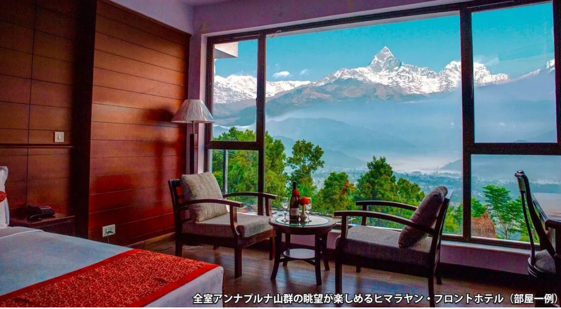
全室アンナプルナ山群の眺望が楽しめるヒマラヤン・フロントホテル (部屋一例)