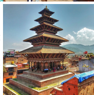
▲ニヤタボラ寺院の五重塔 / 古都バクタプル

ネワール族が多く暮らす古都パタンは、今なお伝統文化が息づき「美の都」と呼ばれます。レンガ造りの中世の建物が多く残るバクタプルなどともに世界遺産に指定されています。