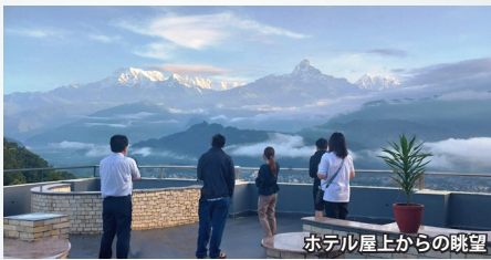
ホテル屋上からの眺望

ヒマラヤ山脈の朝日や夕日を観賞する展望スポットとして知られる標高1,592mのサランコットの丘に位置するホテル。2016年1月開業と比較的新しいホテルです。全客室からアンナプルナ連峰が望めます。また、屋上からも美しいヒマラヤの山々とポカラの町並み、ペワ湖のパノラマをお楽しみいただけます。