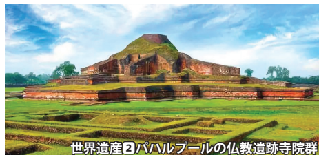
世界遺産②パハルプールの仏教遺跡寺院群