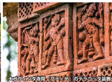
大ゴヴィンダ寺院(プティア)のテラコッタ装飾