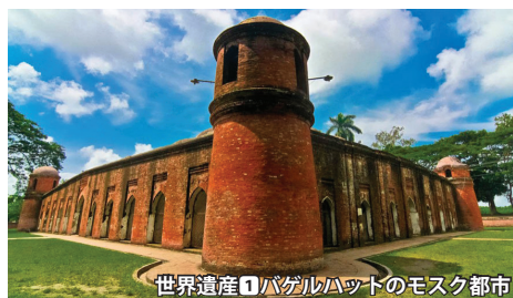
世界遺産①バゲルハットのモスク都市

ガンジス河、ブラマプトラ河、メグナ河の三大河川によって形成された世界最大のデルタ地帯に位置し、日本の4割の国土に1億6000万人が暮らすエネルギー豊富な国バングラデシュ。毎年5～9月の雨季には国土の3分の1が水に覆われます。毎年繰り返される洪水は土壌を肥沃にし、広大な穀倉地帯を支えています。その洪水がもたらす豊かさから「黄金のベンガル」とも呼ばれます。当ツアーでは、かつてインドのベンガル地方として栄えた北部から南部の世界最大級のマングローブ林が広がるデルタ地帯まで大自然、歴史、遺跡、民俗文化など知られざるバングラデシュの魅力をご紹介します。 ◇バングラデシュ三大世界遺産(仏教遺跡パハルプール、イスラム建築バゲルハット、世界最大のマングローブ林シュンドルボン)を訪問。 ◇「歌う修行僧」パウルのラロン音楽をお楽しみいただけます。パウルの歌はユネスコ世界無形遺産に指定されています。