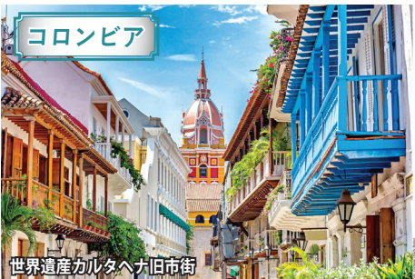
世界遺産カルタヘナ旧市街

コロンビアは南米大陸の北端に位置し、カリブ海沿いのコロニアル都市、アンデス山脈の高原都市など変化に富んだ自然に溢れます。それら多様な自然と黄金郷伝説に代表される優れた先住民文化、コロニアルの街並みなど、実は驚くほど見所豊富なコロンビアへ。