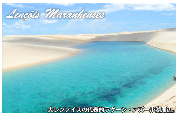
大レンソイスの代表的ラグーン・アズール湖周辺。

※出入国手続き上、黄熱病の予防接種は義務付けられておりませんが、訪問地が予防接種推奨地域に指定されています。