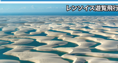
レンソイス遊覧飛行

乾季には白い砂丘だけの風景が、1月～6月の雨季に降り続いた雨水によって姿を変え、砂丘の窪地にエメラルドグリーンの池が次々と現れます。その池には不思議なことに小魚が無数に泳いでおり、池が干上がる前に産卵し、翌年の雨季に再び孵化するという独自のサイクルで命を繋いでいます。バヘリーニャスからはジープに乗り、未舗装の道を約1時間。決して楽なアクセスではありませんが、だからこそ得られる感動は比べものにならないほど大きなものです。当社ツアーでは大レンソイスのみならず、その東側に広がる黄砂の砂漠・小レンソイスにもご案内。プレジサス川のボート・トリップを楽しみながら向かいます。