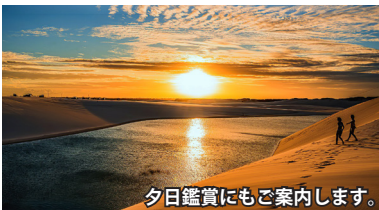
夕日鑑賞にもご案内します。

乾季には白い砂丘だけの風景が、1月～6月の雨季に降り続いた雨水によって姿を変え、砂丘の窪地にエメラルドグリーンの池が次々と現れます。その池には不思議なことに小魚が無数に泳いでおり、池が干上がる前に産卵し、翌年の雨季に再び孵化するという独自のサイクルで命を繋いでいます。バヘリーニャスからはジープに乗り、未舗装の道を約1時間。決して楽なアクセスではありませんが、だからこそ得られる感動は比べものにならないほど大きなものです。当社ツアーでは大レンソイスのみならず、その東側に広がる黄砂の砂漠・小レンソイスにもご案内。プレジサス川のボート・トリップを楽しみながら向かいます。