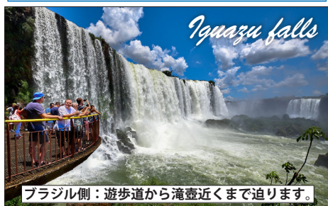
ブラジル側：遊歩道から滝壺近くまで迫ります。