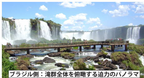
ブラジル側：滝群全体を俯瞰する迫力のパノラマ