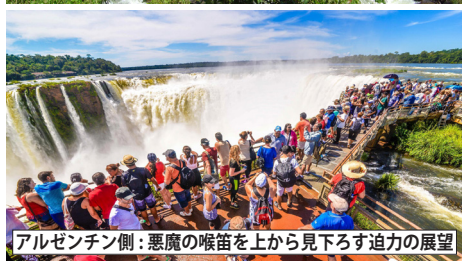
アルゼンチン側：悪魔の喉笛を上から見下ろす迫力の展望

アルゼンチンとブラジルの国境をなすイグアス川最下流部に広がる世界最大級の滝。総延長約4kmにも及ぶ滝群で、最大落差は約80m。ハイライトはイグアス最大の滝「悪魔の喉笛」。当コースではブラジル側とアルゼンチン側の両方から見学し、展望台や遊歩道から迫力の景観をお楽しみいただけます。