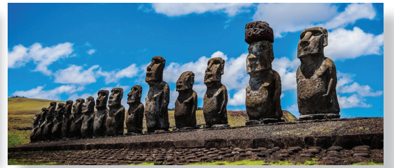
↑ アフ・トンガリキ 島西部の海岸沿いに15体のモアイ像が並ぶ島最大の祭壇。津波などで倒壊していたモアイ像を日本企業の援助により再建されたことで知られます。