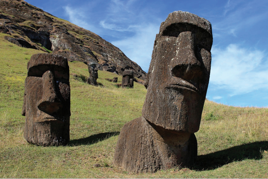
↑ ラノ・ララク イースター島最大の火山で、山自体がモアイの製造工場跡。島内のほとんどのモアイ像は、この山から切り出されました。約400体のモアイが製作途中で放棄された状態で残されているため、その製作過程を窺い知ることのできる貴重な場所でもあります。写真右側のモアイが島で最大と言われるピロピロと呼ばれるモアイです。