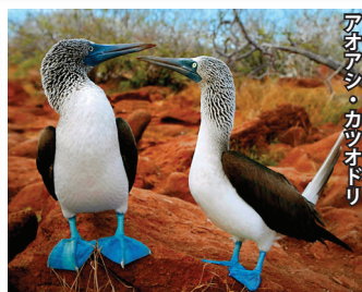
アオアシ・カツオドリ