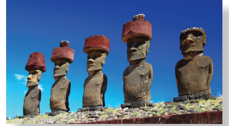
↑ アフ・ナウナウ 土の中から掘り出され復元された7体のモアイ像。砂に埋もれたため保存状態が良く、そのうち4体はプカオという赤い帽子のような石材を載せています。