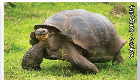
ガラパゴス・ゾウガメ