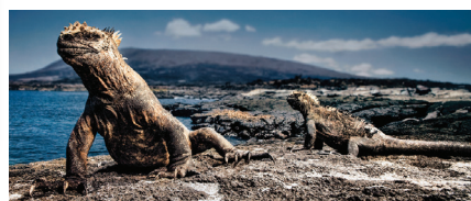
↑ ガラパゴス・ウミイグアナ 世界で唯一海に潜って海藻を食べるイグアナ。