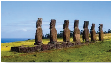
↑ アフ・アキビ 島のほぼ中央にある7体のモアイ像。他のモアイ像と異なり、海を向いて立っていることで知られます。