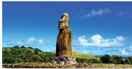
↑ アフ・フリ・ア・ウレンガ 海岸沿いではなく、草原の中に単体で立つ珍しいモアイ像。深い眼孔の凛々しい顔つきが特徴のモアイ像です。