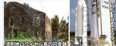
流刑地ロワイヤル島の囚舎跡

南米大陸北部、スリナムとブラジルの間に位置するフランスの海外県。人種はフランス人とインディオの混血系43%、その他57%。19～20世紀にフランス本土より政治犯を中心に囚人がギアナに送られ、「呪われた土地」、「緑の地獄」と呼ばれていました。カイエンヌの西にあるクールーには欧州宇宙機関のスペースセンター(ロケット打ち上げ施設)があることで知られています。