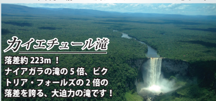
カイエチュール滝

南米大陸北部、ベネズエラの東に位置する国。首都はジョージタウン。1966年に英国より独立。公用語は英語。人種はインド系51%、アフリカ系43%、その他6%。国土の80%は熱帯雨林で覆われている。年間通して高温多湿の熱帯雨林気候。見所は基盤上に美しく整備された首都ジョージタウン、ナイアガラの滝の5倍の落差を誇るカイエチュール滝、ブラジルとの国境を静かに流れるオリन्दェイック滝など。