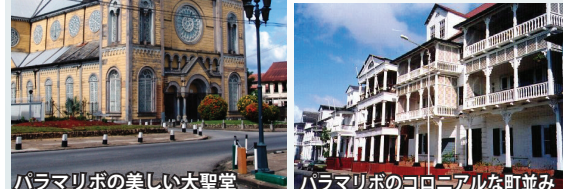
パラマリボの美しい大聖堂

南米大陸北部、ガイアナと仏領ギアナの間に位置する国。首都はパラマリボ。1975年オランダより独立。公用語はオランダ語。 人種はインド系37%、白人と黒人の混血系31%、インドネシア系15%、アフリカ系10%と人種のつぼ。国土の80%以上は熱帯雨林。見所は世界遺産に指定される美しいコロニアルの町・首都のパラマリボ。