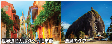
世界遺産カルタヘナ旧市街 悪魔のタワー

中米パナマの南、南米大陸の根元に位置する国。1810年スペインから独立。1903年パナマが分離独立。公用語はスペイン語。人種は混血(メスチソ)が75%。スペイン侵略以前は、極めて発達した先住民文化があり、エルドラド(黄金郷)伝説を生んだ国。世界でも珍しい塩で出来た岩塩教会、旧市街が美しい世界遺産の城塞都市カルタヘナ、高さ220mの一枚岩ピエドラ・デル・ペニョール(悪魔のタワー)、カラフルな家々が並ぶグアタペなど見所多彩。