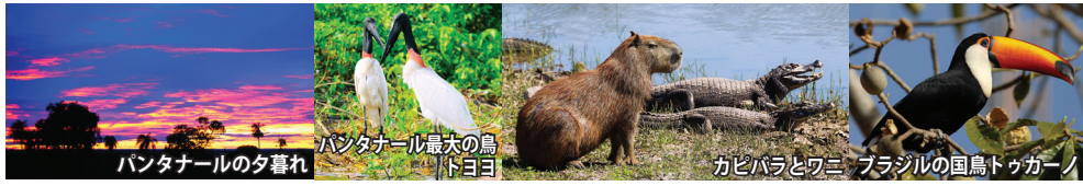
パンタナールの夕暮れ、パンタナール最大の鳥トウヨヨ、カピバラとワニ、ブラジルの国鳥トゥカーノ

パンタナール湿原 ブラジル、パラグアイ、ボリビアにまたがる、日本の本州とほぼ同じ広さの世界最大の大湿原。地球上で最も大きな野生生態系として、世界遺産に登録されています。雨季(10月から4月)と乾季(5月から9月)に分かれ、その水位の増減が多量の魚類を育み、その魚類が無数の鳥類(約665種)を惹きつけるのです。また、げっ歯類最大のカピバラやアライグマ、ワニなどの哺乳類・爬虫類も多く生息し、まさに生命の楽園。中央パンタナールでは乾季になると飲み水を求め、ジャガーが川辺に姿を現します。ボートサファリにてジャガーウォッチングにトライします。