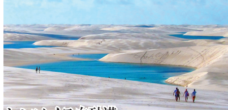
レンソイス白砂漠 雨季には、まるでシートを一面に広げたかのような真っ白な砂丘にエメラルドグリーン色の湖沼が出現する世界屈指の絶景地です。

◆世界最大の湿原・パンタナールへ。ジャガー・サファリにもご案内します。 乾季のこの季節のみ観光できる大湿原。南米固有種カピバラ、アライグマなどの哺乳類から、パンタナール最大の鳥トウヨヨ、ブラジルの国鳥で愛嬌あふれるトゥカーノなどの鳥類まで、野生動物との出会いをお楽しみ下さい。中央パンタナールでは、ジャガー・サファリにもご案内します。 ◆驚異の白砂漠レンソイス国立公園へ。 上空からの遊覧飛行に加え、白砂漠は終日観光。大レンソイスに加え、小レンソイスにもご案内。