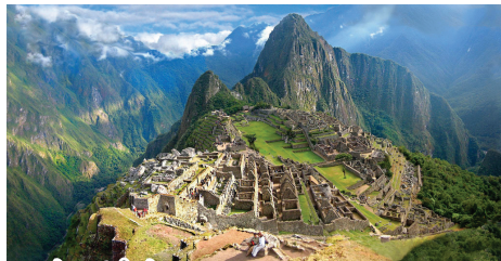
マチュピチュ 標高2400mの尾根に造られた、15世紀のインカ帝国の空中都市がマチュピチュ。建造理由や建造方法も謎の「世界の七不思議」です。