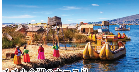
チチカカ湖のウロス島 標高3,890mに位置する「天空の湖」チチカカ湖。全て葦で作られた浮島・ウロス島には約500人の先住民族が住んでいる。