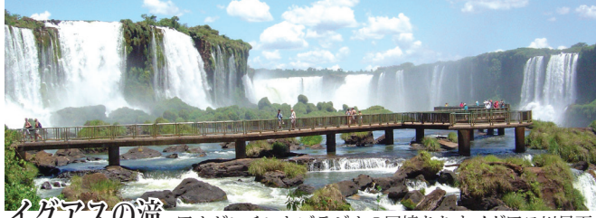
イグアスの滝 アルゼンチンとブラジルの国境をなすイグアス川南流部にある世界最大の滝。滝幅4km、最大落差約80m。滝のハイライトはイグアス最大の滝「悪魔のどぶえ」。当コースではブラジル側、アルゼンチン側の両方から見学。展望台と遊歩道から迫力の展望をお楽しみ下さい。

※マチュピチュにスーツケースは持っていきません。2泊3日分の荷物を入れるバックをお持ち下さい。 ※ナスカの地上絵の遊覧飛行は他のお客様との混載になります。また、悪天候などにより、航空会社の判断で飛行ルートが急遽変更となる場合がございます。遊覧飛行自体が中止となった場合は、ご帰国後、お一人様につき20,000円をご返金いたします。