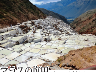
マラスの塩田 クスコ近郊インカの聖なる谷にあるプレ・インカ時代から続く塩田。山間にある塩田は世界でも稀で、乾季のみ見られる絶景地です。