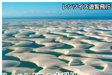
レンソイスの白砂漠

乾季には白い砂山だけのところに、1月～6月の雨季に降り続いた雨水が砂丘に溜まり、エメラルドグリーンに輝く池が現れます。その池には不思議なことに無数の小魚が泳いでいます。池が干上がる前に卵を産み、再び雨季が来ると孵化するというサイクルで、生を繋いでいるのです。バヘリーニャスからジープに乗って未舗装の道を約1時間。決して楽なアクセスではありませんが、だからこそ得られる感動も比べ物にならないほど、大きなものなのです。当社ツアーでは大レンソイスだけでなく、その東側に広がる黄砂の砂漠・小レンソイスも訪問。プレギサス川のボート・トリップをお楽しみいただきながら向かいます。