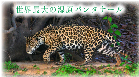
湿原の王者ジャガーの他、カピバラやトゥウユ、カイマンなど多彩な野生動物が息づく生命の楽園です。