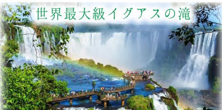
ブラジル側の展望台から望む、イグアスの滝の圧巻の全景

ブラジルが誇る四大絶景を一度に味わう 15 日間。轟音と水煙に包まれるイグアスの滝、野生動物が息づく世界最大級の湿原パンタナールではボートサファリでジャガーを探します。さらにアマゾン川クルーズで大河の生命力に触れ、旅の後半は白砂漠レンソイスへ。ブラジルの大自然を南から北まで巡り、多彩な景観と生命の躍動を体感する旅です。