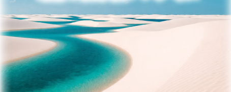
純白の砂丘にエメラルドの湖が点在するレンソイスの幻想風景。