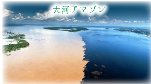
黒いネグロ川と茶色のソリモンエス川が出会う神秘的な合流点へ。混ざらず並んで流れる不思議な光景をご覧ください。

イヤホンガイド・サービスを使用します。 昼食時、夕食時にドリンク・ウォーターをサービスします。