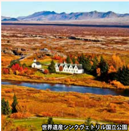
世界遺産シングヴェトリル国立公園