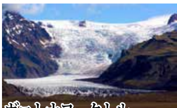
ヴァトナヨークトル ヨーロッパ最大の氷河で、総面積は約8,100

高さ62mの壮大なスコウガフォス、パイプオルガンのような造形美スヴァルティフォスなどの滝や奇岩レイニストランガーを遠望するブラックサンドビーチを訪問。また、ヨーロッパ最大の氷河ヴァトナヨークトルでは氷塊が浮かぶヨークルスアゥロン湖をクルーズします。