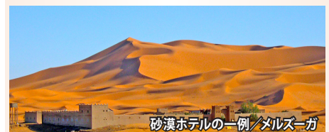
砂漠ホテルの一例／メルズーガ

世界最大・幻想のサハラ砂漠に抱かれた一夜をどうぞ。見渡す限りの砂の海、静寂の空間。そこは喧噪の日常を離れた別世界です。夕暮れ時の砂漠は、黄金色から深紅のバラ色へ、そして深いワイン色へと表情を変えて行きます。やがて深い闇が訪れ、ふと空を見上げると、今にも降り出しそうに星々が輝き始めます。まさに天然のプラネタリウム。世界中でここでしか味わうことの出来ない贅沢なひとときをどうぞ。