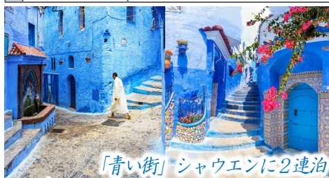
「青い街」シャウエンに2連泊

シャウエン 山間に広がる青の街シャウエン。15世紀に渡来したユダヤ教徒が、天と神を象徴する聖なる色とされる青で家々を染めたと伝わり、迷路のような旧市街には静かな青の風景が息づきます。