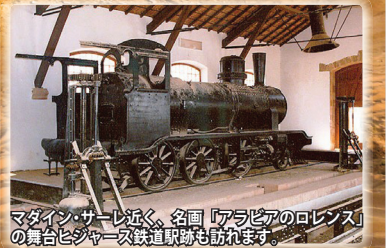
マダイン・サーレ近く、名園「アラビアのロレンス」の舞台ヒジャーズ鉄道駅跡も訪れます。