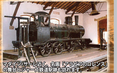
マダイン・サーレ近く、名画『アラビアのロレンス』の舞台ヒジャーズ鉄道駅跡も訪れます。