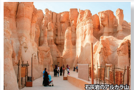
石灰岩のアルカラ山

世界遺産⑤ アハサー・オアシス 砂漠ばかりのサウジアラビアですが、アハサー地方にだけは古くから水が豊富に湧き、コム、ナツメヤシなどの農業が盛んに行われてきました。アハサー・オアシスは250万本のヤシが生育する世界最大のオアシス。人間が現在まで進化させてきた人類と環境の関わりを如実に表していることから世界遺産に認定されました。