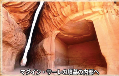
マダイン・サーレの墳墓の内部へ