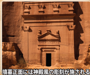
墳墓正面には神殿風の彫刻が施される