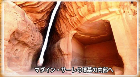
マダイン・サーレの墳墓の内部へ

～湾岸地域を回避した安心ルートでご案内！訪問地は外務省海外安全情報・危険情報レベル1の地域のみ～