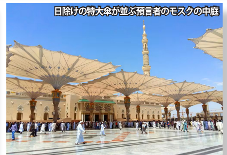
日除けの特大本傘が並ぶ預言者のモスクの中庭

マラヤ・コンサートホール アル・ウラに位置するマラヤ・コンサートホールは、砂漠の中に突如現れる近未来的な建築で、外壁を全面ミラーで覆った独特の外観が特徴です。周囲の岩山や砂漠の風景を映し込み、まるで風景と一体化するかのような幻想的な姿を見せます。