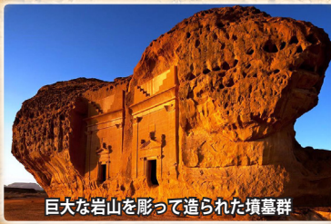
巨大な岩山を彫って造られた墳墓群