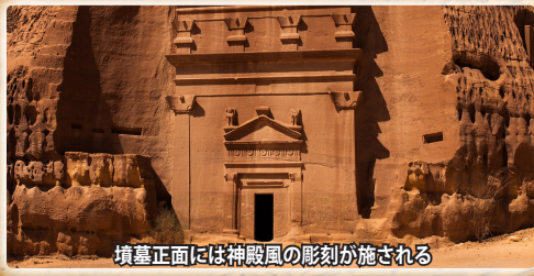
墳墓正面には神殿風の彫刻が施される