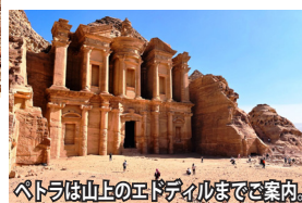
ペトラは山上のエディパルまで観光。