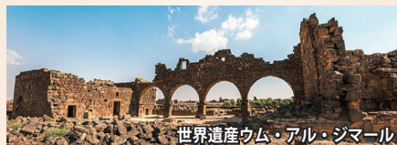
世界遺産ウム・アル・ジマール

2024年に世界遺産に新登録。玄武岩から成り、「砂漠の黒い真珠」と呼ばれています。