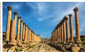
ジェラシュ 古代ローマの栄光を今に伝える「中東のポンペイ」。

二千年以上前、ナバティヤ人によって建設された交易都市跡。均整の取れた姿と緻密な彫刻が美しいエル・ハズネは中東で最も美しい遺跡のひとつと言われます。