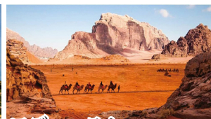
ワディ・ラム 赤茶色の砂漠と奇岩が広がる絶景の世界遺産。