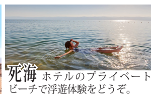
死海 ホテルのプライベートビーチで浮遊体験をどうぞ。