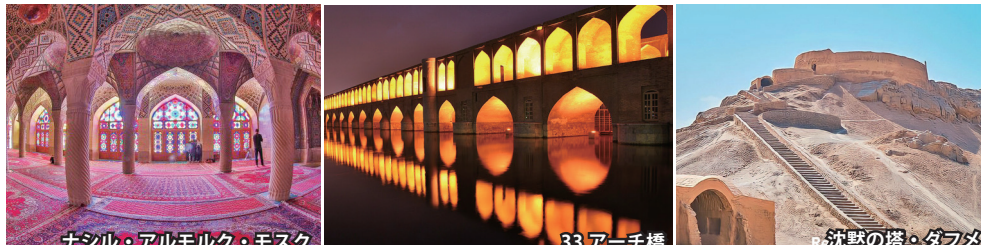
ナシル・アルモルク・モスク