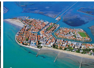
グラード 本土と1本の橋で繋がった干潟の島。5世紀からの歴史があり、旧市街には初期キリスト教会が残る。