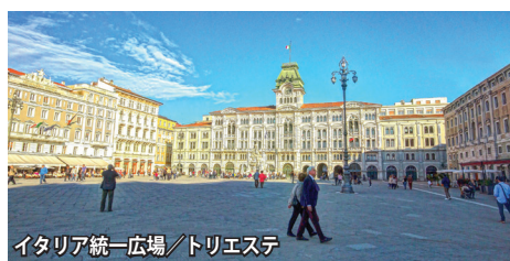
イタリア統一広場/トリエステ

トリエステ イタリアの最東端フリウリ＝ヴェネチア・ジュリア州の州都トリエステ。ローマ時代からの歴史を持ち、その後、アクイレイア、ヴェネチアの支配を経て、14世紀末にオーストリア・ハンガリー帝国の庇護下に入り貿易港として栄えました。マリア・テレジアの時代に帝国唯一の海への玄関口として栄え、ハプスブルク家の雰囲気漂う、ネオ・クラシックの美しい街並みが整備されました。皇妃エリザベートはトリエステを愛し、この港からマルタ島やコルフ島などへ旅に出たと云われています。また、須賀敦子さんのエッセイ『トリエステの坂道』で描かれた街としても有名です。当ツアーでは、トリエステにゆったり7連泊し、フリウリ＝ヴェネチア・ジュリア州の小さな珠玉の街々を巡ります。また、隣国スロベニアも訪れ、ユリアン・アルプスの美しい景勝地トルミン渓谷を訪れます。