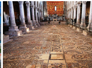
アクイレイア バジリカの床一面を覆う4世紀のモザイクは壮観。ローマ遺跡とともに世界遺産に登録。