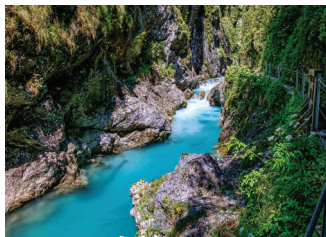
トルミン渓谷 (スロベニア) ユリアン・アルプス西部、ターコイズ・ブルーの清流沿いのハイキングへ。

※成田空港発着となる場合もございます。成田発となった場合、空港使用料・保安サービス料は3,010円となります。 ※教会、修道院などは、ミサや巡礼の時期、その他の理由で入場出来ない場合もございます。その場合、代替観光にご案内します。 ※観光順序を入れ替えてご案内する場合もございます。