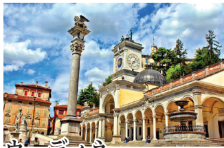
ウーディネ フリウリ＝ヴェネチア・ジュリア州第二の都市。リベルタ広場は「イタリアで最も美しいフレスコ画が描かれた家々がヴェネチア様式の広場」といわれます。残る。特に城の壁画は圧巻。