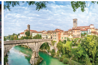
チヴィダーレ・デル・フリウリ 中世初期のロンゴバルド族の痕跡が残っており、世界遺産に登録。

イヤホンガイド・サービスを使用します。 昼食時、夕食時にドリンク・ウォーターをサービスします。