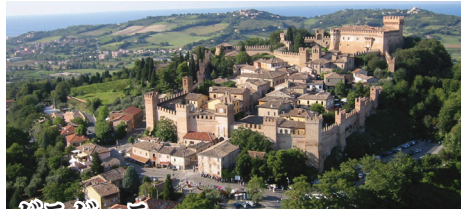
グラダラー マルケ州の「イタリアの最も美しい村」。城を中心とした町は二重の防壁で囲まれる。