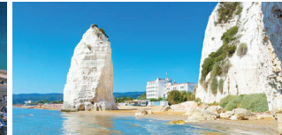
ガルガーノ半島 プーリア州の秘境。突き出した城壁に囲まれた地域が旧市街。巨大な石灰岩ピッツォ・ムノは圧巻。