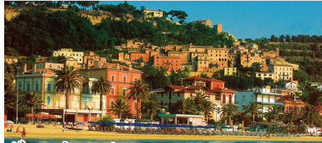
グロッタマール マルケ州の「イタリアの最も美しい村」。賑やかな海岸付近の高台には中世の街並みが広がるといふ、珍しい構図の村です。