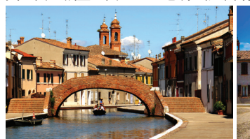
コマッキオ ポー川デルタ近くのラグーンの町。町のシンボルは交差する3つの運河を跨ぐ階段状の橋・トレポンティ。静かな水路と独特の橋、そして中世の残る家並みは、とても絵になる「とっておき」の町です。