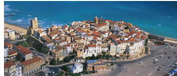
テルモリ モリーゼ州の港町。海に突き出した城壁に囲まれた地域が旧市街。巨大な石灰岩ピッツォ・ムノは圧巻。

*成田空港発着となる場合もございます。成田発となった場合、空港使用料・保安サービス料は3,010円となります。