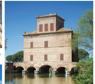
アパーテの水門 16世紀のエステ家によるポー川デルタの開拓の象徴。川の水の管理以外に要所の防御監視も兼ねての建物でした。閘門の開閉システムは、かのレオナルド・ダ・ヴィンチが発明したものの。