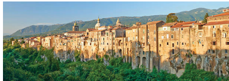
サンターガダ・ディ・ゴージェ カンパニア州の「イタリアの最も美しい村」。2本の川に浸食された凝灰岩の上に聳える村。

ナポリを起点に、これまで紹介されることが少なかったカンパニア州中北部とモリーゼ州の見所を辿り、イタリア東岸へ。そして、アドリア海沿いを北上し、途中途中で、個性豊かな田舎町や「イタリアの最も美しい村」を巡る旅です。