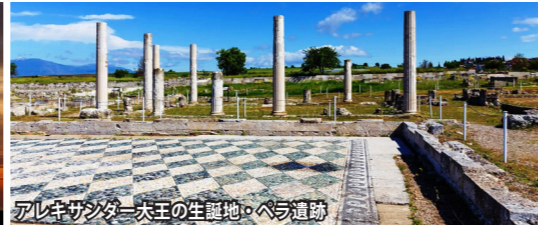
アレキサンダー大王の生誕地・ペラ遺跡