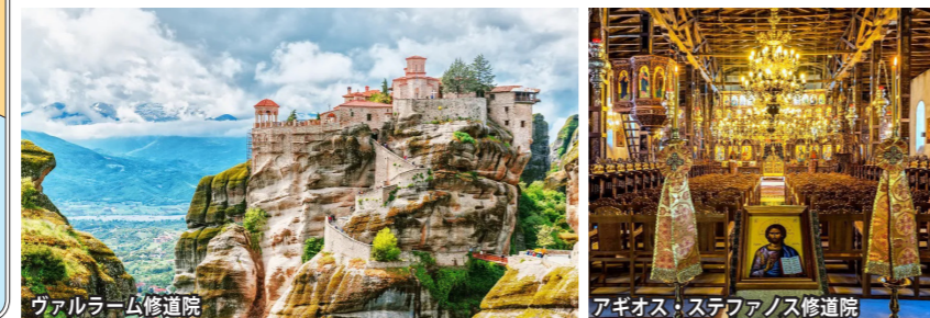
ヴァルラーム修道院

圧倒的な威容・メテオラの修道院群 ギリシャのほぼ中央、ピンドス山脈の奇岩の上に建つメテオラの修道院群。このメテオラの語源「メテオロス」とは古代ギリシャ語で「空中に浮く」という意味の形容詞。この言葉通り、高い物では400mもの高さに修道院が建てられています。ギリシャ正教の若き修道士が「神の近くに近づきたい」との思いから建てたのが始まり。今世紀初めまでは階段もはしごもなく、下界とのやりとりは全て人間も含めて、滑車に吊るした網袋だけでした。内部には中世の見事なフレスコ画を見ることができ、世界自然遺産と文化遺産の複合遺産となっています。今も厳しい戒律を守る修道士の姿を見ることが出来、絶景でありながら、荘厳な印象を受ける地なのです。