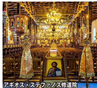
アギオス・ステファノス修道院