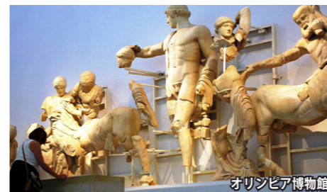
オリンピア博物館

ペロポネソス半島 の世界遺産の数々も訪問。オリンピック発祥の地オリンピア、医学の神アスクレピオスを祀るエピダウロス遺跡、シュリーマンにより発掘されたことで知られるミケーネ遺跡にご案内。また、それぞれ付属の博物館も見学します。