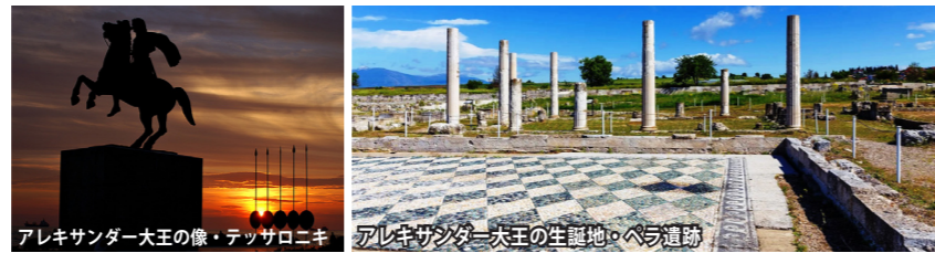
アレキサンダー大王の像・テッサロニキ

ミコノス島南西に位置する無人島が、世界遺産のディオロス島。島全体が遺跡で、まさに野外の考古学博物館。古代ギリシャでは聖地とされており、ギリシャ神話において、太陽神アポロンと月の女神アルテミスが誕生した地とされています。