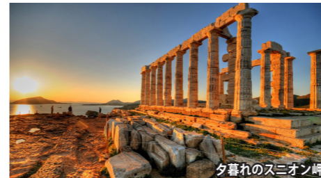
夕暮れのスニオン岬

スニオン岬 アテネ南東約70キロ、アッティカ半島最南端のスニオン岬。断崖に立つポセイドン神殿は航海の守護神を祀り、夕刻には白い柱が茜色に染まります。エーゲ海に沈む夕陽と神殿が織りなす情景は、ギリシャ随一の絶景として知られています。