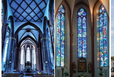
シャガール・ブルーの教会 マインツ・聖シュテファン教会: シャガールの青いステンドグラスで教会内は青い光で満たされます。