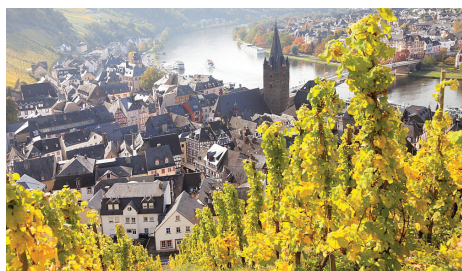
ベルンカステル・ケース 蛇行するモーゼル河沿い、色付いた葡萄畑と木組みの家々が美しい。

通常のツアーでは訪れる機会の少ないルール地方の知られざる見所(モノトーンの家々が並ぶフロイデンベルク、世界遺産アーヘン大聖堂など)を巡り、ベルギーとの国境近くアイフェルの森へ。森の中の小村モンシャウなどにご案内します。その後、モーゼルの美しい流れに沿って、コブレンツへ。途中、河畔の美しい街や名城エルツ城に立ち寄ります。旅の最後はフランクフルトに宿泊。フェルメールの作品も所蔵するシュテューデル美術館など通常、観光する機会の少ないフランクフルト市内観光にもご案内します。