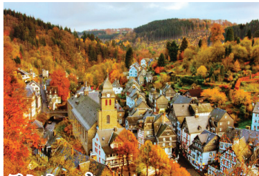
モンシャウ 銀色のスレート葺きの木組みの家々と周囲の黄葉との対比が美しい「 アイフェルの真珠 」と呼ばれます。

※教会、修道院などは、突然のミサや巡礼の時期、その他の理由で入場出来ない場合もございます。その場合、代替観光にご案内します。 ※羽田空港発着となる場合もございます。羽田発となった場合、空港使用料・保安サービス料は3,050円となります。