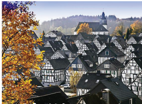
フロイデンベルク グレーの屋根に白い壁のコントラストが美しい、伝統的木組み建築の館が整然と並んでいるモノトーンの街。