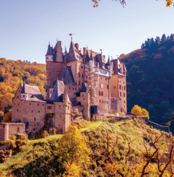
エルツ城 アイフェルの森の中に突如現れる名城。ドイツ三大美城のひとつと言われています。

イヤホンガイド・サービスを使用します。 昼食時、夕食時にドリンク・ウォーターをサービスします。