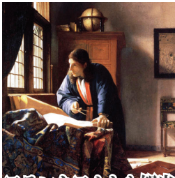
フランクフルトも観光 シュテューデル美術館ではフェルメールの作品も鑑賞。