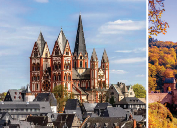
リンベルク大聖堂 他の町ではみられない、鮮やかな色合いで彩られた大聖堂。