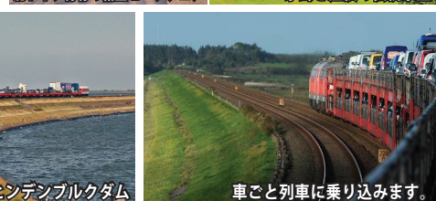
島と本土をつなぐ土手ヒンデンプルクダム