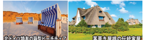
茅葺き屋根の伝統家屋