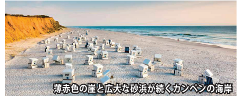
薄赤色の崖と広大な砂浜が続くカンペンの海岸

日本ではあまり知られていませんがドイツ人が憧れる高級リゾート地です。島といっても、本土からは鉄道で行きます。島に向かって延びる鉄道専用の土手(ヒンデンプルクダム)の上を列車は走ります。その全長は11kmで、左右に広がる北海を眺めながらの列車の旅では、特別な気分を味わうことが出来ます。茅葺きの美しい家々が点在するカイトゥム村や薄赤色の崖と広大な砂浜が続くカンペンの海岸など特徴ある見所を巡ります。