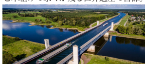
マクデブルク エルベ川の上を運河が立体交差する欧州最大級の水路橋。家々が並び、中世情緒あふれる町。