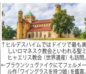
↑ヒルデスハイムではドイツで最も美しいロマネスク教会といわれる聖ミハエリス教会(世界遺産)も訪問。 ←ブラウンシュヴァイクにてフェルメルム作「ワイングラスを持つ娘」を鑑賞。