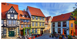
クヴェトリンブルク 戦禍を免れ石畳と木組みの家々が残る世界遺産の古都。