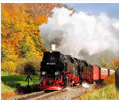
ハルツ狭軌鉄道 蒸気機関車で魔女伝説息づくブロッケン山頂へ向かいます。

イヤホンガイド・サービスを使用します。 昼食時、夕食時にドリンクウォーター(飲用水)をサービスします。