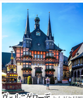
ヴェルニゲローデ とんがり屋根の市庁舎が町のシンボル。木組みの