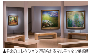
▲モネのコレクションで知られるマルモッタン美術館