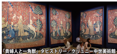
「貴婦人と一角獣」タビストリー／クリュニー中世美術館