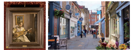
フェルメール 可愛らしいカフェやレストランが立ち並ぶ 《ギターを弾く女》 ハムステッド・ハイ・ストリート

■マーケット巡り■ 11世紀から存在したロンドンで最も古い食品市場バラや、ヨーロッパ屈指の骨董市ポートベロー、アンティークの掘出し物が見つかるジュビリー・アンティーク・マーケットなど、マーケット巡りもロンドンの楽しみの一つです。