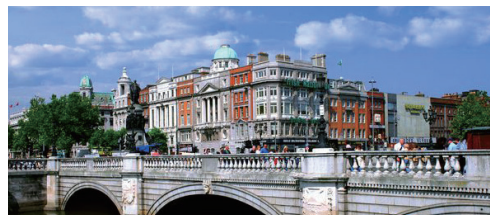
▲ダブリン市街とオコンネル橋