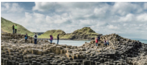
▲六角形の玄武岩の石柱群ジャイアンツ・コースウェイ(世界遺産)

※教会、大聖堂などは、宗教行事や冠婚葬祭などにより、急遽、入場、見学出来なくなる場合もあります。その場合、代替観光にご案内します。また現地事情により、観光内容の順番が入れ替わる場合があります。