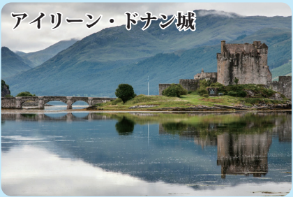
アイリーン・ドナシ城

ゴルフの聖地として世界的に有名で、中世からの歴史を持つスコットランド最古の大学がある、東海岸沿いの美しい古都。