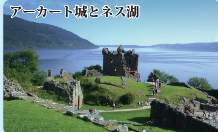
アーカート城とネス湖

旅の最後・ロンドンでは終日自由行動。ご希望の方は大英博物館などにご案内します。（入場料は無料ですが予約必須）