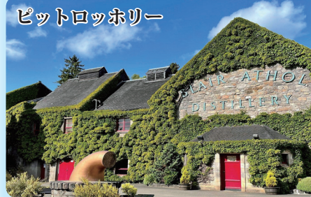
ピットロッチホリー

ネッシー伝説の地ネス湖のほとりに立つ、中世スコットランドの壮大な城跡です。湖に突き出た岬にあり、美しい景観が楽しめます。