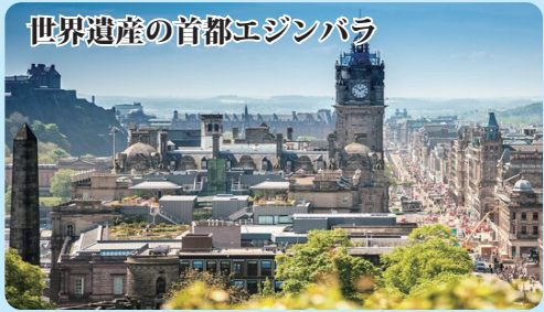
世界遺産の首都エジンバラ

スコットランド西部をグラスゴーからマレイグまで、荒々しい荒野を海にの撮影に使われたことでも有名です。