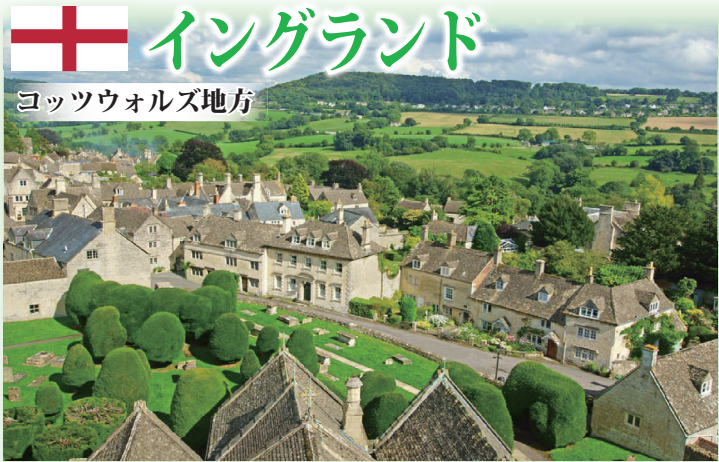
コッツウォルズ地方

◆北はインバネスから南はロンドンまで 1500km 大縦断、2 連泊が 5 回のゆとりの日程で巡ります◆