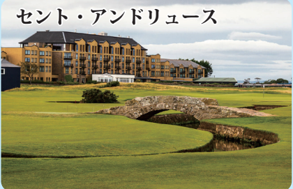
セント・アンドリュース

スコットランド最古の認可蒸留所の一つ、ブレア・アソール蒸留所。美しい石造りの建物で、甘くスパイシーなシングルモルトを生産しています。