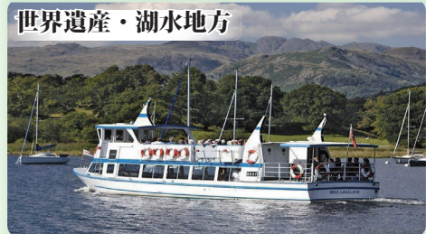
世界遺産・湖水地方

ブロンテ姉妹（シャーロット、エミリー、アン）が暮らし、『嵐が丘』などの傑作を生み出した文学の舞台です。姉妹ゆかりの家や、小説の着想源となった荒涼としたヒースの丘が広がります。