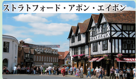
ストラトフォード・アポン・エイボン

詩人ワーズワースがその美しさを世界で紹介した、湖や山々が織りなす国立公園。『ピーターラビット』の作者ビアトリクス・ポターが愛し、晩年を過ごした地としても有名です。