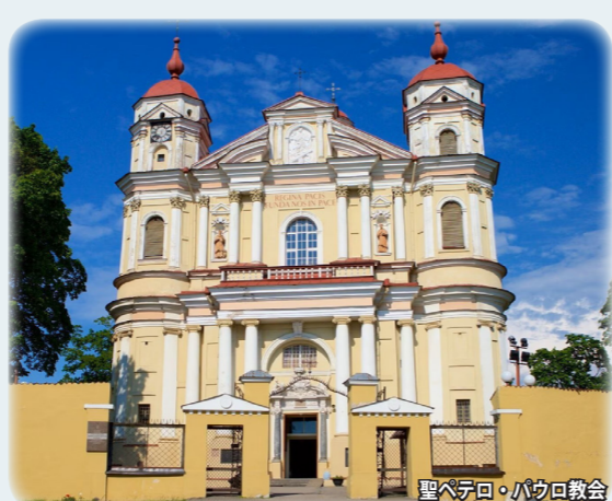
聖ペテロ・パウロ教会