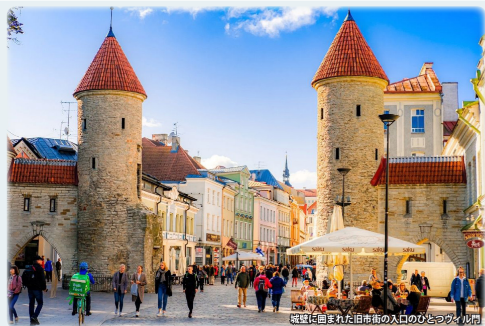
城壁に囲まれた旧市街の入口のひとつヴィル門

ハンザ同盟時代の商人が活躍し、栄華を極めた頃の街並みが残るエストニア、ラトヴィア、リトアニア。3カ国の首都の旧市街は、何れも世界遺産に登録されています。街の観光だけでは単調になるところ、当コースでは、世界遺産クルシュ砂州、「ラトヴィアのスイス」ガウヤ国立公園、「ヨーロッパの原風景」サーレマー島、ムフ島など自然・景観美も堪能いただけます。