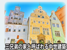
三兄弟の家と呼ばれる中世建築

ゴシック様式の優雅な建築物が並ぶことから、「バルトのパリ」と称されます。一方、新市街にはアールヌーボー様式(ユージェントシュティール)の建築物も見ることが出来ます。