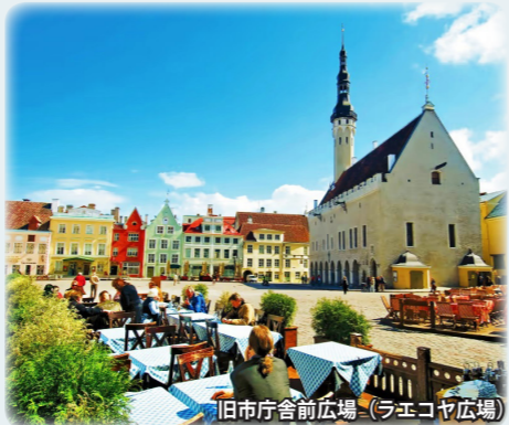
旧市庁舎前広場 (ラエコヤ広場)

13～15世紀にかけてバルト海貿易を担うハンザ同盟の中心地として急成長を遂げ、北ヨーロッパ随一の美しい街並みが築かれました。旧市街は散策するのに丁度良い大きさで、建物や路地はどこを撮っても絵になります。旧市街・山の手の丘の上、トームベアからは、旧市街の絶景が一望出来ます。