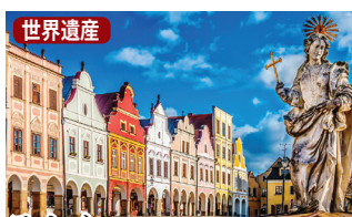
テルチ テルチネサンス様式の広場が美しく「モラヴィアの真珠」と讃えられます。

※チェコに渡航の際は、海外旅行保険の加入及び保険証券の携帯が必要となります。詳しくはお問合せ下さい。 ※モラヴィアの大草原は、道路事情により、車窓観光となる場合もございます。予め、お含みおき下さい。