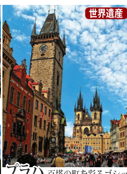
プラハ 百塔の町を彩るゴシックの尖塔群、ヴルタヴァ河畔に広がる歴史薫るプラハ旧市街。