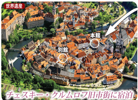
チェスキー・クルムロフ旧市街に宿泊