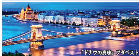
「ドナウの真珠」ブダペスト

「ドナウの真珠」ブダペスト、古都ショブロンなどの美しい街々に加え、中欧最大のバラトン湖周辺、ハンガリー大平原(プスタ)などの見所も訪問します。