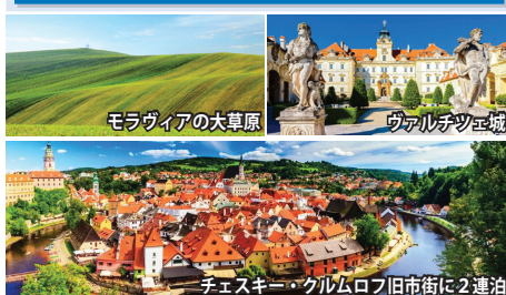
モラヴィアの大草原