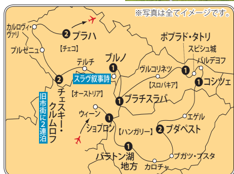
※写真は全てイメージです。