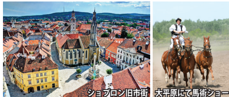
ショブロン旧市街 大平原にて馬術ショー