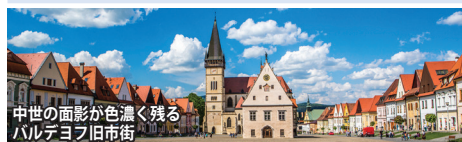
中世の面影が色濃く残る バルデヨフ旧市街

通常は首都のブラチスラバのみの観光が多い中、欧州の原風景が残る東部の田舎町も丹念に訪問。