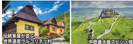
伝統家屋が並ぶ 世界遺産ヴルコリネツ村