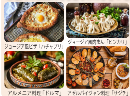
ジョージア風ピザ「ハチャプリ」