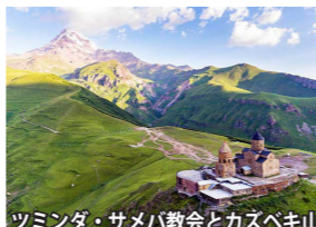
ツミンダ・サメバ教会とカズベキ山

ジョージア軍用道路を、十字架峠を越え、カズベキへ。山裾には緑の牧草が広がり、雪を抱くコーカサスの山並みが美しい絶景ルートが続きます。当ツアーではカズベキに宿泊し、絶景のツミンダ・サメバ教会を訪れたり、ホテルからのんびりとカズベキ山の雄姿をご覧いただいたりと、山岳風景をお楽しみいただけます。