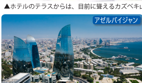
アゼルバイジャン

アゼルバイジャンの首都バクー 旧市街には世界遺産の中世の建造物が残る一方、新市街ではカスピ海油田が産むオイルマネーにより中東のような近未来的なビルが続きと建設され活気に溢れています。