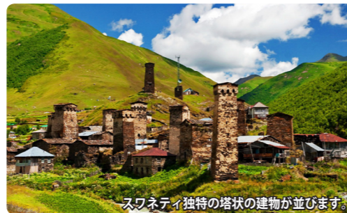
スワネティ独特の塔状の建物が並びます。

その桃源郷は大コーカサス山脈の懐深く、美しい峡谷の中にあります。歴史的に外部と隔絶されていたため、独自の伝統文化が残ります。一番の特色は石で出来た塔状の家。12世紀に造られたものが多く、この地域には約200の塔が残っています。スワネティ最奥のウシュグリでは、雪を被る5000m級の大コーカサスの峰々、独特の塔状の家々と緑鮮やかな尾根の美しいコントラストが見られます。まさにこれこそが桃源郷と呼ぶべき光景なのです。