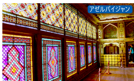
アゼルバイジャン

世界遺産シキ ハーン宮殿は18～19世紀にかけて絹の取引によって築かれたもので、この町のかつての繁栄を象徴した建造物です。