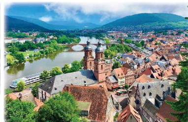
ミルテンベルク「マイン川の真珠」と呼ばれる、丘の上の城と木組みの家並みが美しい中世の町。