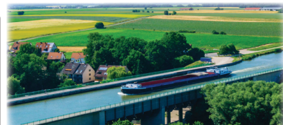
マイン＝ドナウ運河 マイン川のバンベルクからドナウ川のケールハイムまで全長約171kmに及ぶ運河。16の水門を通過し水位を調整しながら船は進みます。1992年に完成した運河で、これにより北海から黒海まで水路で繋がることになりました。