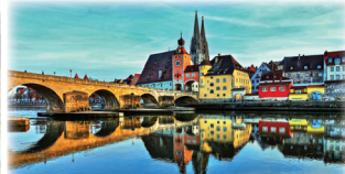
世界遺産レーゲンスブルク ローマ時代から栄えたドナウ河畔の要衝の町。