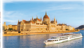
世界遺産ブダペスト 旅の最後は「ドナウの真珠」ブダペストに終日停泊。