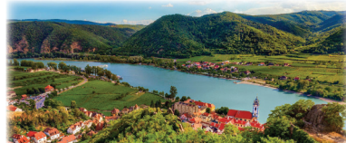
世界遺産ヴァッハウ渓谷 古城やブドウ畑が点在し、ドナウ川で最も美しいと言われます。