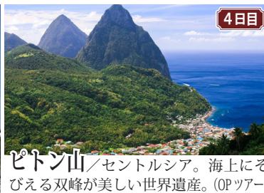
4日目 ピトン山/セントルシア。海上にそびえる双峰が美しい世界遺産。(OPツアー)