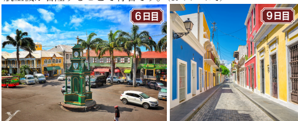
6日目 パセテール/セントキッツ&ネイビス。フランス人によって入植され、18世紀に英国統治へ。2つの国の影響を残す街並みが魅力の島です。