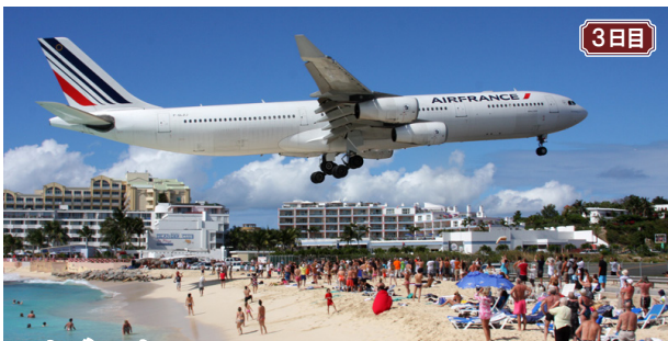
3日目 マホビーチ/オランダ領セントマーチン島。頭上ギリギリに航空機が着陸することで有名です。(OPツアーにて)

※2011年3月1日以降にイラン、イラク、シリア、スーダン、イエメン、ソマリア、リビア及び北朝鮮に渡航または滞在したことがある方、また2021年1月2日以降にキューバに渡航したことがある方は、米国非移民ビザ(実費185米ドル)の取得が必要となるため、必ずお申し出下さい。