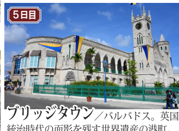
5日目 ブリッジタウン/バルバドス。英国統治時代の面影を残す世界遺産の港町。