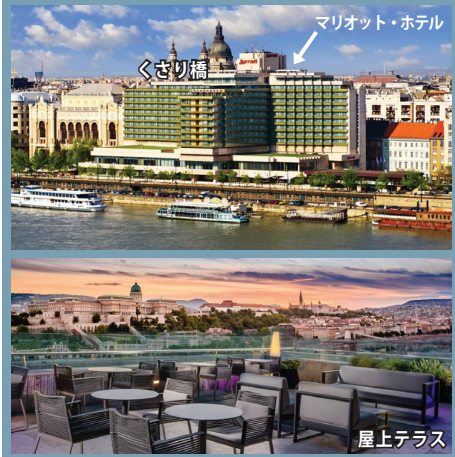
マリオット・ホテル

ブダペスト：マリオット(ドナウ・ビュー) 市内中心ドナウ川沿いに建つ5つ星ホテル。くさり橋などの主要な観光スポットやブダペスト随一の繁華街ヴァーツィ通りも徒歩圏。