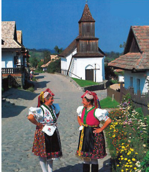
世界遺産ホーロケー村 トルコ系の少数民族が住み、独自の伝統を守っています。

くさり橋 ドナウ川を境にしたブダ地区とペスト地区を初めて結んだのがくさり橋。王宮を背景にライトアップされたくさり橋はまさに絶景。