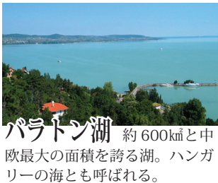
バラトン湖 約600km 2 と中欧最大の面積を誇る湖。ハンガリーの海とも呼ばれる。

※教会、修道院、国会議事堂などは、ミサや議会開催などの理由で急遽入場出来なくなる場合がございます。その場合、代替観光にご案内します。 ※「ドナウ・ビューの部屋」は、ホテル側がそのように規定する部屋を指し、必ずドナウ川の全景が見渡せるとは限りません。