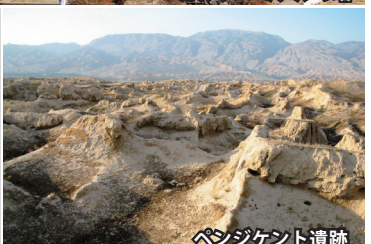
ベンジケント遺跡

イヤホンガイド・サービスを使用します。 昼食時、夕食時にドリンク・ウォーターをサービスします。