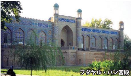
フダヤル・ハン宮殿