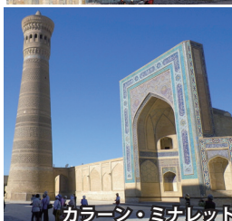
カラーン・ミナレット