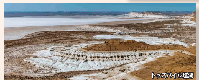
トゥズバイル塩湖