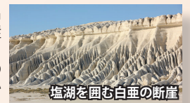
塩湖を囲む白亜の断崖

古代の地中海と称される「テチス海」の名残の塩湖。周囲は高さ100mの白亜の断崖が10km以上続きます。塩湖の中には、様々な条件で水が残ると鏡張りのように周囲の景色を映し出します。水がない場合は白い台地が続く絶景がご覧いただけます。