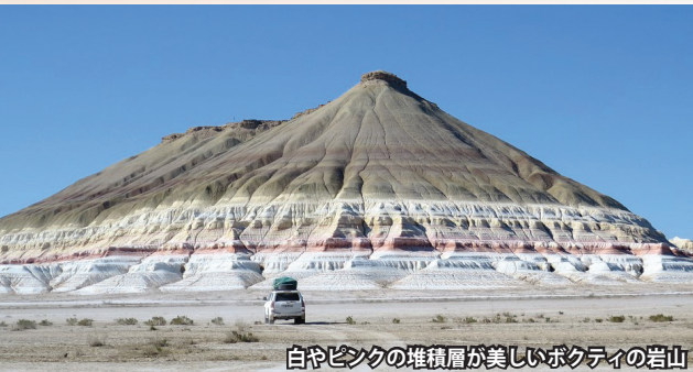
白やピンクの堆積層が美しいボクティの岩山