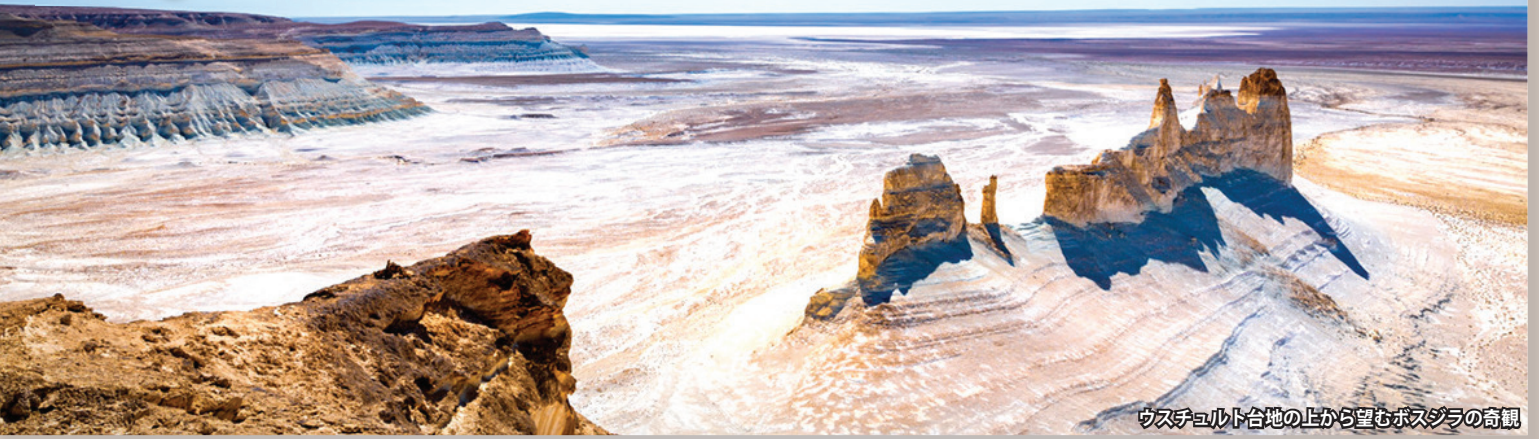
ウスチュルト台地の上から望むボスジラの奇観