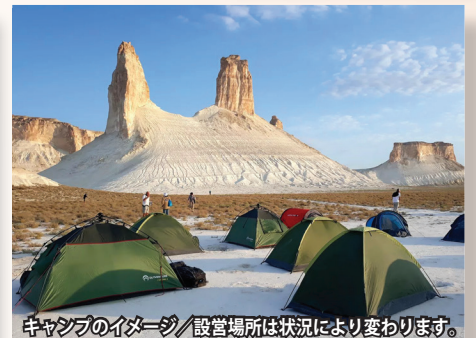
キャンプのイメージ/設営場所は状況により変わります。