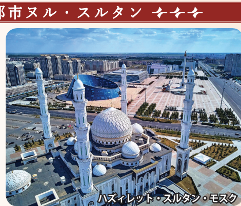
ハズィレット・スルタン・モスク

新生カザフスタンの首都として1997年にアルマトィから遷都。建築家・黒川紀章氏の都市計画に基づき建設、開発が進められ壮大な建築群が出現しました。町のシンボル、バイテレクタワーなど斬新な建物が多く建ち並び、まさに「草原の中に突如として現れた近未来都市」と言えるでしょう。