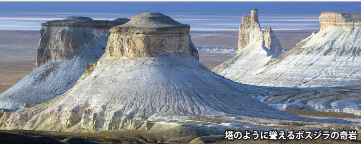
塔のように聳えるボスジラの奇岩