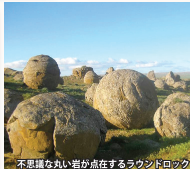
不思議な丸い岩が点在するラウンドロック