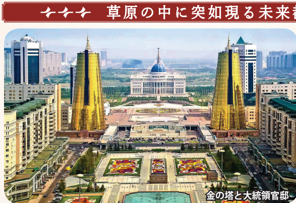
金の塔と大統領官邸