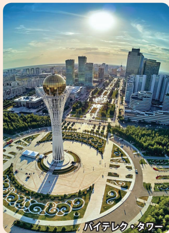
バイレック・タワー