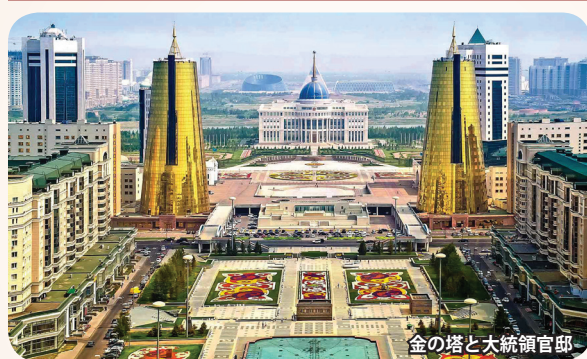
金の塔と大統領官邸