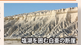
塩湖を囲む白亜の断崖

古代の地中海と称される「テチス海」の名残の塩湖。周囲は高さ100mの白亜の断崖が10km以上続きます。塩湖の中には、様々な条件で水が残ると鏡張りのように周囲の景色を映し出します。水がない場合は白い台地が続く絶景がご覧いただけます。