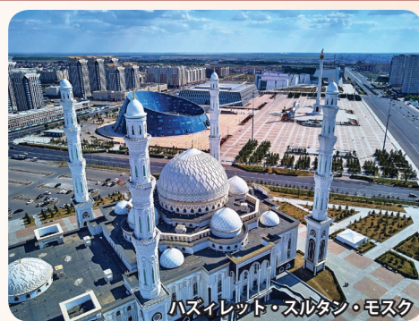
ハズイレット・スルタン・モスク

新生カザフスタンの首都として1997年にアルマティから遷都。建築家・黒川紀章氏の都市計画に基づき建設、開発が進められ壮大な建築群が出現しました。町のシンボル、バイレックタワーなど斬新な建物が多く建ち並び、まさに「草原の中に突如として現れた近未来都市」と言えるでしょう。